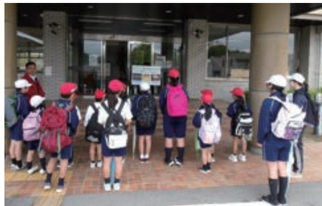
三和支所前でクイズに挑戦！

三和小学校「1年生歓迎遠足」が5月2日(金)に行われました。4班に分かれて、三次消防署三和出張所や三和支所などを歩いて訪問し、クイズを楽しみました。